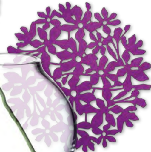
Podkładka Flower Power – filc, średnica 40 cm, 55 zł, Glamstore.