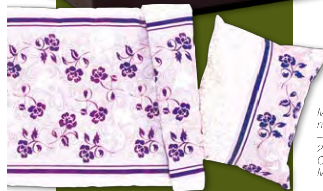
Pościel Rina – bawełna i poliester, poszewka 140 x 200 cm, poszewka 50 x 60 cm, 49,95 zł, Jysk.