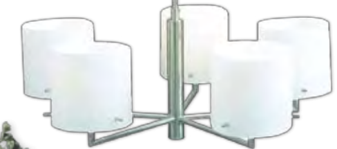
Lampa wisząca Rimini – metal i szkło, średnica 45 cm, 543 zł, Quelo.