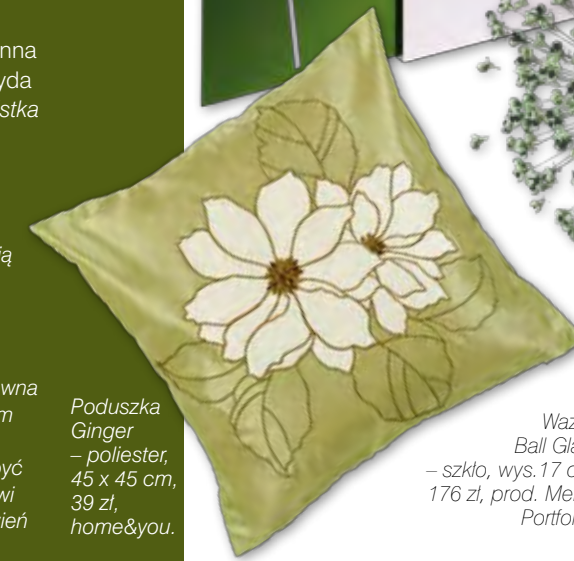
Poduszka Ginger – poliester, 45 x 45 cm, 39 zł, home&you.