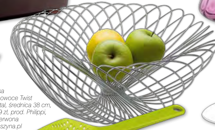
Misa na owoce Twist – stal, średnica 38 cm, 299 zł, prod. Philipp, Czerwona Maszyna.pl