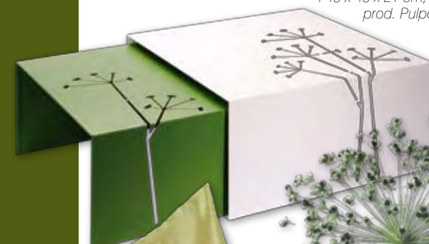
Stoliki Makrame Flore – stal lakierowana, 46 x 45 x 23 cm i 45 x 45 x 21 cm, 1090 zł/komplet, prod. Pulpo, Fabryka Form.